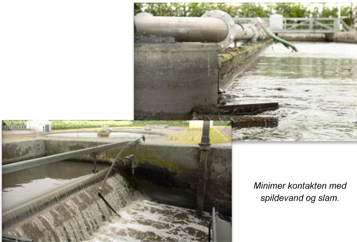
Minimer kontakten med spildevand og slam.

Spildevand indeholder mikroorganismer, som kan medføre sygdom. Den største smitterisiko findes ved direkte kontakt med spildevand og slam i arbejdssituationen eller ved direkte kontakt via øjne, næse og mund.